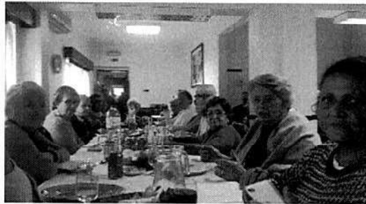
Dia da mulher