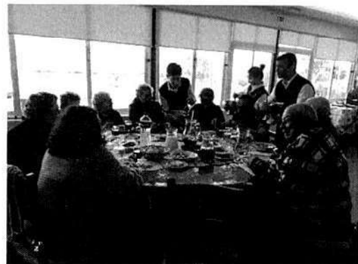
Almoço de Natal