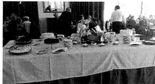
Comemoração de 25 de Abril