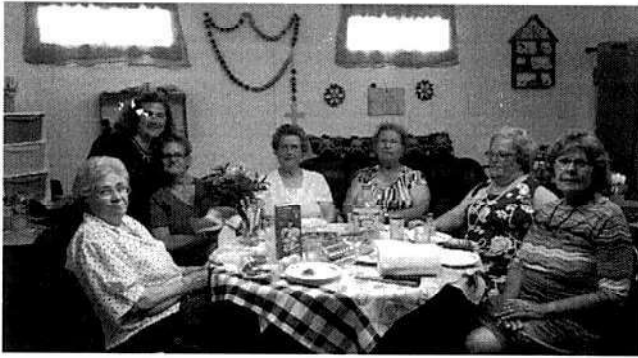
Festas de aniversário